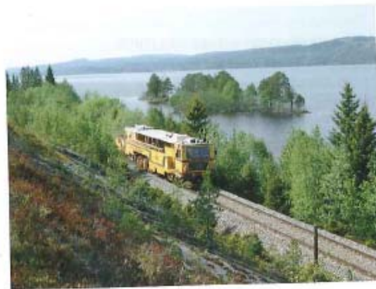
Bild 4: LEONHARD WEISS ist aktiv im europäischen Ausland – hier ein Einsatz in Norwegen

LEONHARD WEISS schreibt seit 110 Jahren eine mittelständische Erfolgsgeschichte. Diese Entwicklung verdankt das Unternehmen unter anderem der weitsichtigen Unterstützung durch alle Gesellschafter und der großen Verbundenheit der Mitarbeiter. Durch beständige Weitergabe der vom Firmengründer gelebten Werte wird das mittelständische Fa-