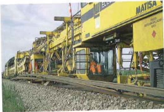
Bild 2: LEONHARD WEISS setzt modernste Maschinenteknik ein – hier der Schnellumbauzug „EdelWeiss“

arbeiter, weitere 450 Mitarbeiter sind im hoch spezialisierten Geschäftsbereich „Ingenieur- und Schlüsselfertigbau“ sowie der Fußbodentechnik beschäftigt. Die Dienstleistungen unterstützen die operativen Bereiche in allen kaufmännischen Belangen. Hier findet man auch die im Jahr 2004 gegründete LEONHARD WEISS-Akademie. Zahlreiche stabile Tochterunternehmen – als Beispiel die SDC – Steinanierung und Denkmalpflege Crailsheim – und Beteiligungen prägen das Gesamtbild der LEONHARD WEISS Gruppe. Die etwa 205 Auszubildenden im Bauhandwerk und in der Verwaltung führen zu gezielter Mitarbeitergewinnung, zu einer festen Verbundenheit und damit zu einem hohen Einsatzwillen mit der erforderlichen Flexibilität. Der Geschäftsbereich Gleisbau war der „Rote Faden“ im Unternehmen LEON-