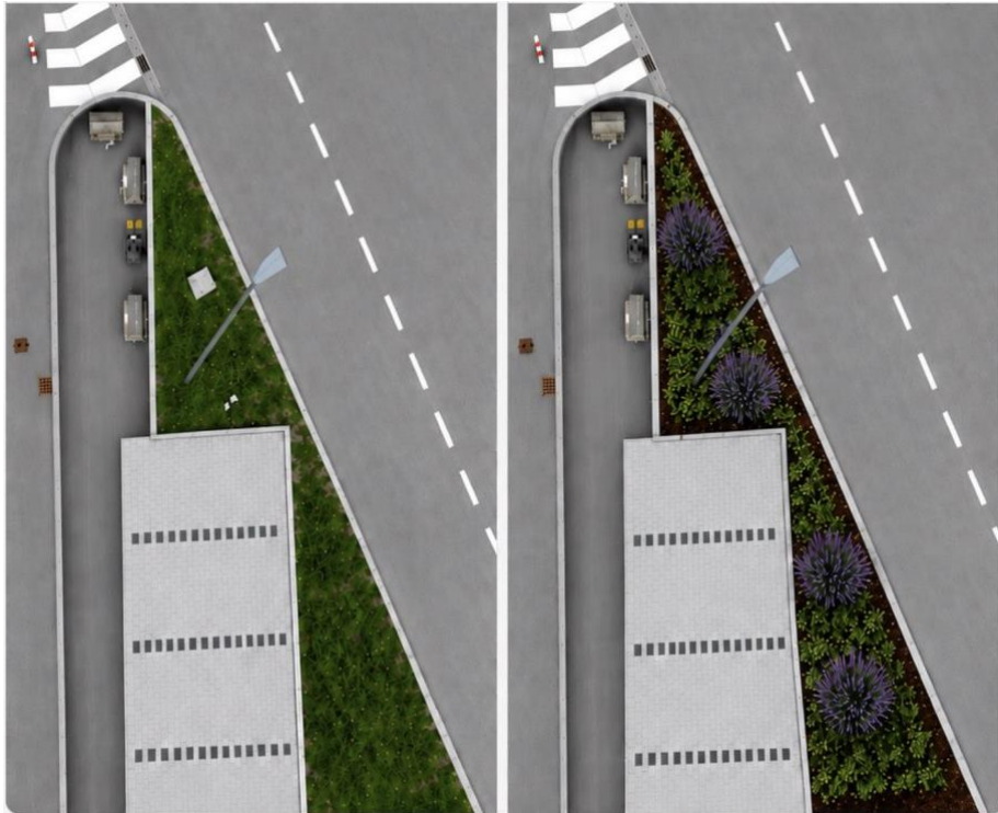
Visualisierung 1 links vorher, rechts nachher: Blütensalbei, Kleiner Immergrüner Bodendecker und Rindenmulchstreifen werden gepflanzt und angelegt.